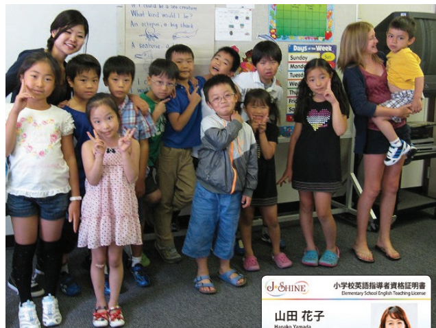
J-SHINEから与えられる資格証明書