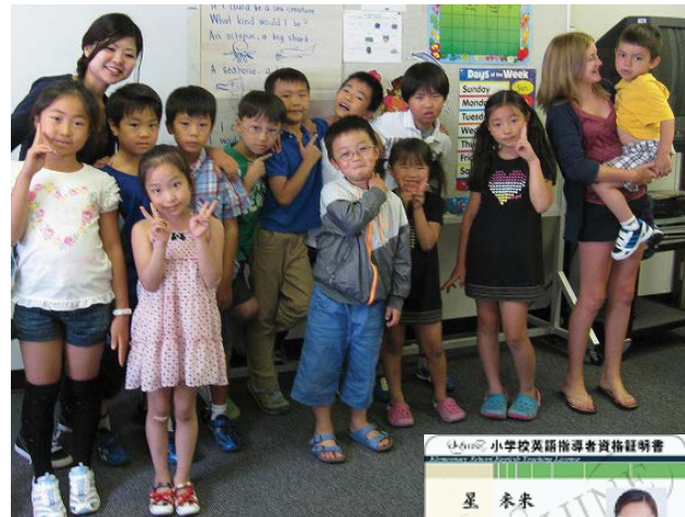
J-SHINEから与えられる資格証明書